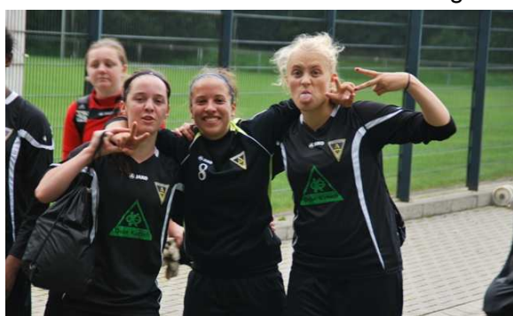
Leistungsorientiert und trotzdem mit Spaß dabei, der Nachwuchs der Aachener Alemannia

Pünktlich um 09.55 piffen die vom Fußballkreis 4 abgestellten Schiedsrichter die Spiele an. Aber halt, ein Spielfeld, und zwar der Kunstrasenplatz war kurzzeitig nicht bespielbar, weil wohl Vandalen -offensichtlich in den Nachtstunden- ein Tor beschädigt hatten. Es wurde gegen ein transportables Gehäuse ausgetauscht und so konnten dann doch mit nur wenigen Minuten Verzögerung alle drei Spielfelder genutzt werden.