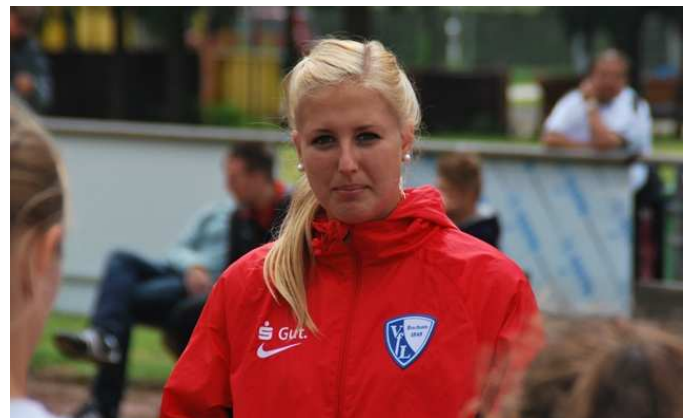
Wie immer - Sympathische Gäste aus Nah und Fern beim AOK Cup 2014

Vertreter vom FC Finnentrop und der Fortuna aus Freudenberg zum großen niederrheinischen U-17 Juniorinnen Kräftenessen in Mönchengladbach - Rheindahlen an.